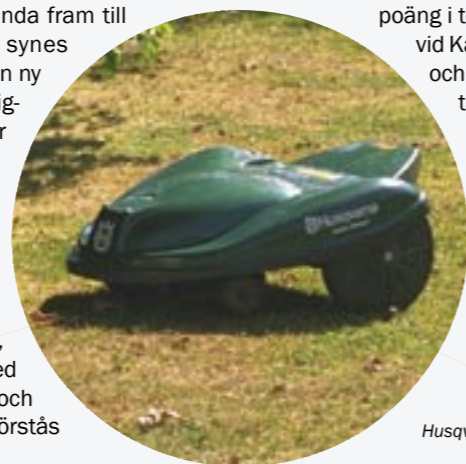
Husqvarna Auto Mower

– Första gången vi såg maskinen i arbete var tanken: Det här kan aldrig fungera. Men det gör det. Märkligt nog fixar den, med sitt sicksackande, gräset i hela trädgården, med undantag för någon kant och något hörn, och här får vi förstås klippa manuellt.